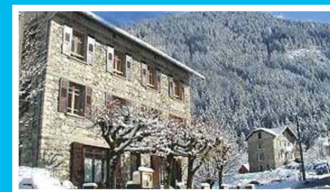
STAGE AVEC HÉBERGEMENT